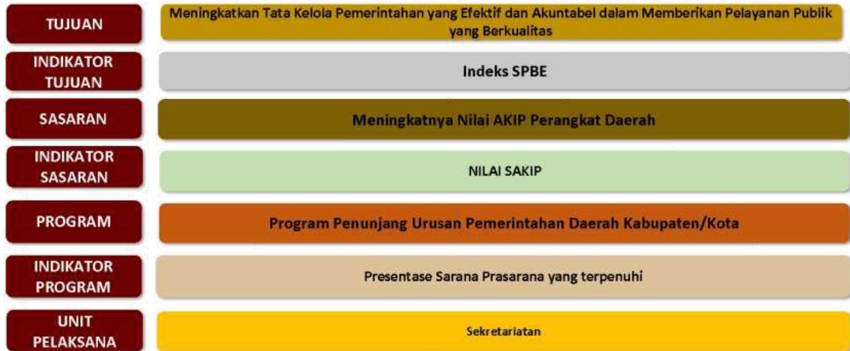
Gambar 4. 2 Cascading Dinas Komunikasi Dan Informatika Kabupaten Pamekasan : Sasaran 1