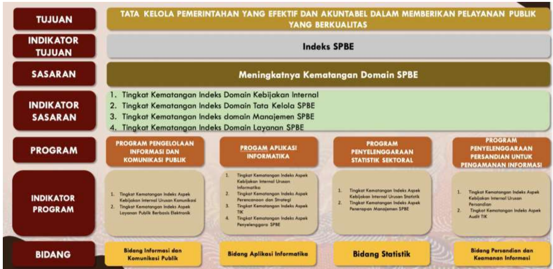
Gambar 4. 3 Cascading Dinas Komunikasi Dan Informatika Kabupaten Pamekasan : Sasaran 2